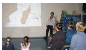
Diaporama dans une école Gif-sur-Yvette