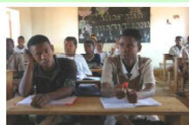
Un cahier pour tout matériel ? Ankilizato, Moyen Ouest