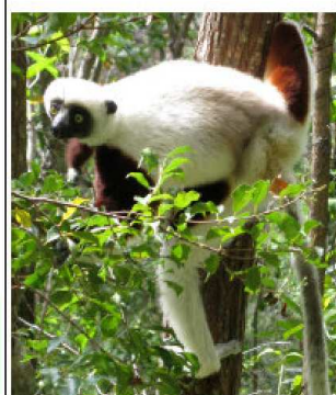
Livret documentaire et conte/sketch + affiches. Sur la destruction de la forêt primaire, des lémuriers...