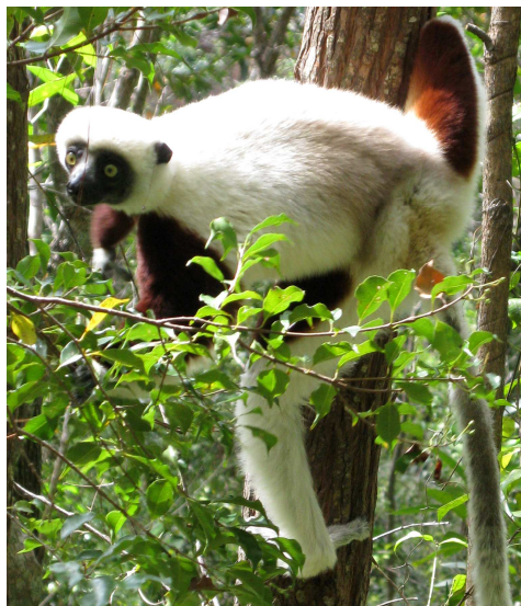
Livret documentaire et conte/sketch + affiches. Sur la destruction de la forêt primaire, des lémuriens...