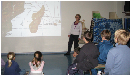
Diaporama dans une école Gif-sur-Yvette