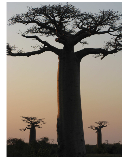
Former pour sauver une nature unique !