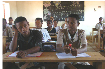
Un cahier pour tout matériel ? Ankilizato, Moyen Ouest